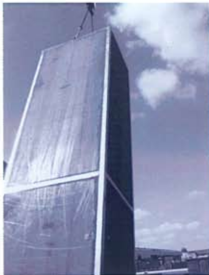
Kolom waarop het stuurhuis geplaatst wordt

De taxatiewaarde van het m.s. Frisian Lady is echter ook hoger vastgesteld dan waar aanvankelijk van is uitgegaan. Dit is goed nieuws omdat, ondanks dat het schip duurder is geworden, de