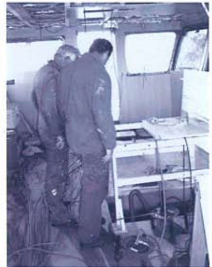
Werkzaamheden in het stuurhuis

Hoogste prioriteit heeft op dit moment het in de vaart brengen van het m.s. Frisian Lady.