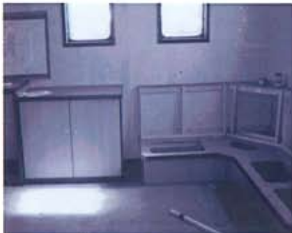
Interieur van het dekhuis in wording

In het dekhuis is een kantoor om onder andere havenautoriteiten te kunnen ontvangen. Tevens is hier het dagverblijf / messroom en de keuken gesitueerd.