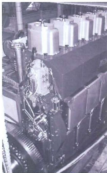
Machinekamer met hoofdmotor